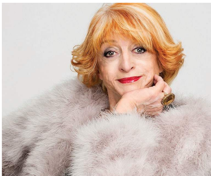
Styling: Janne Skarpeid Hermansen, Jakke fra Ravn

Verden der ute er viktigere enn deres egen. Hun forteller at noen unge til og med foretrekker å svare på mobilen selv om de befinner seg i samme rommet som venner eller familie, fordi de føler seg mer komfortable, kanskje tryggere, når de forholder seg til mobilen. Hun konkluderer med at teknologi får oss til å glemme hva vi vet om livet.