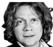
VEILE LID LARSEN [Forfatter]

Da jeg ringte på, tok det lang tid før noen åpnet: De stirret mistenksomt og skremt på meg.